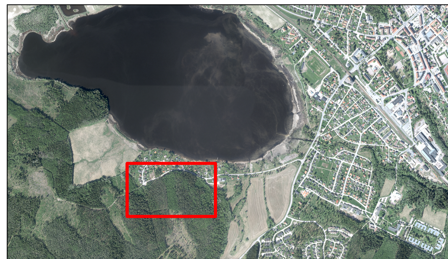
Detaljplan för del av Brunnsjöberget 1:122 Småhusområde vid Västkusten - Hedemora kommun Skala 1:1000 Översiktskarta 1:15000