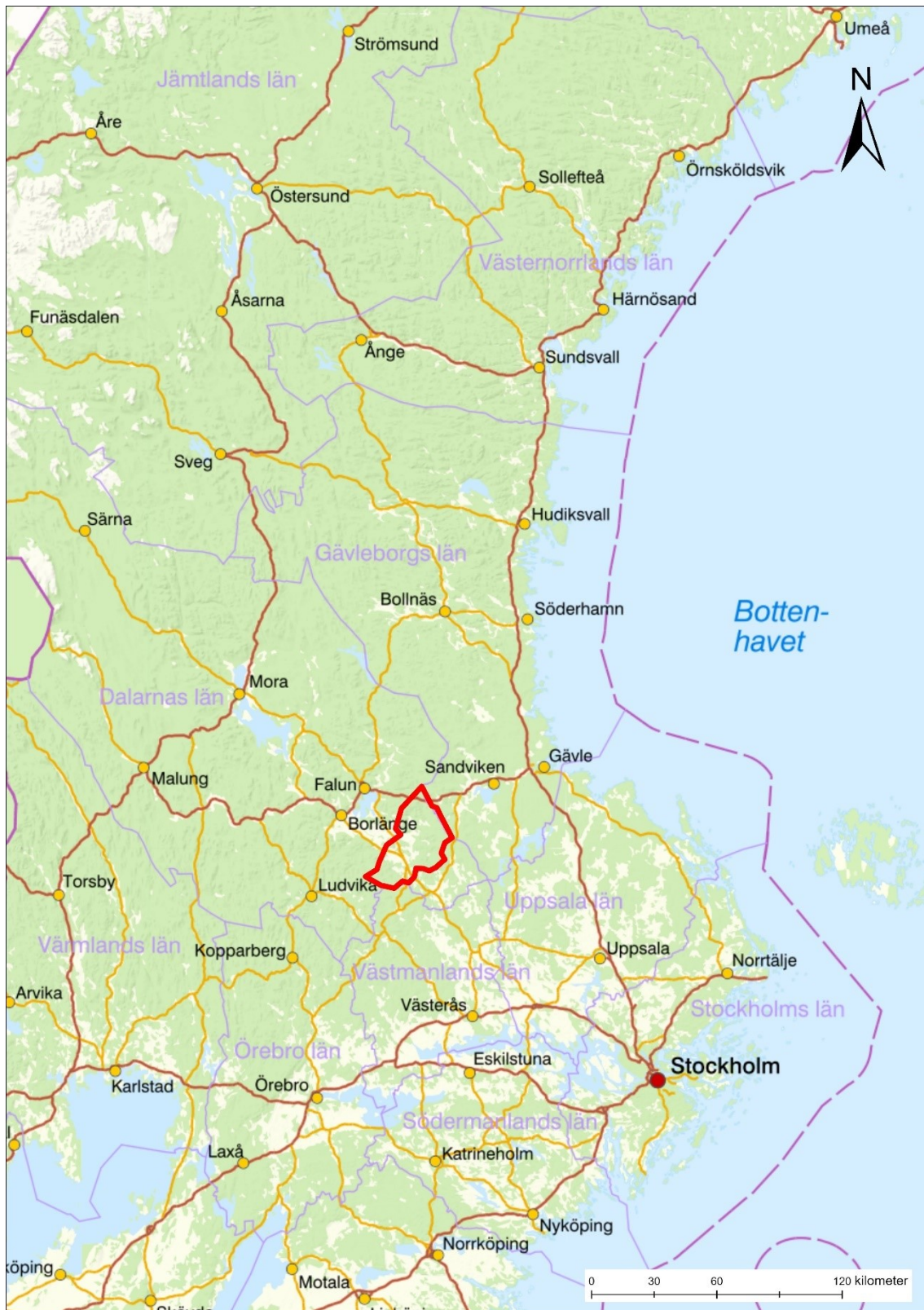
Figur 1. Översiktskarta med Hedemora kommun markerad med röd färg.